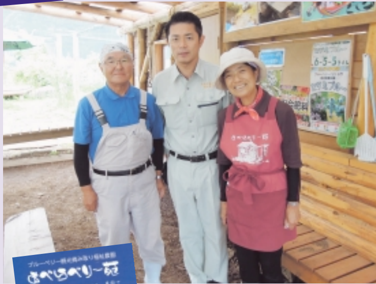
【あべらべりー苑】 観光ブルーベリー農園及び 農福連携の取組について