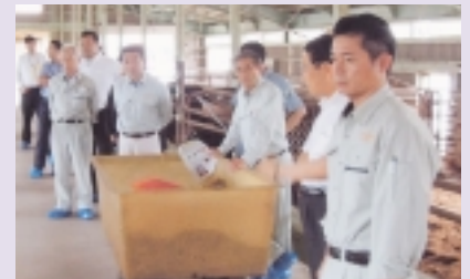
【東通村「野牛川レストハウス」 及び村営牧場】 「東通牛」の村内一貫繁殖肥育の 取組等について